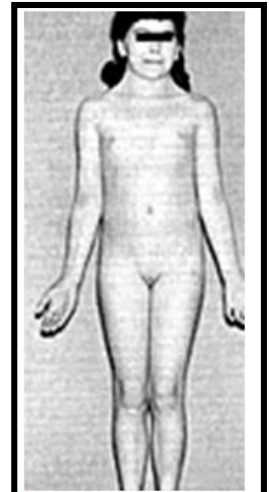
Síndrome de Turner.